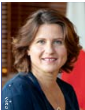
Roxana Maracineanu Ministre des Sports

Le sport est à la fois un enjeu et un symbole. Un enjeu de santé, de bien-être, d'éducation, de cohésion sociale mais aussi un symbole de liberté.